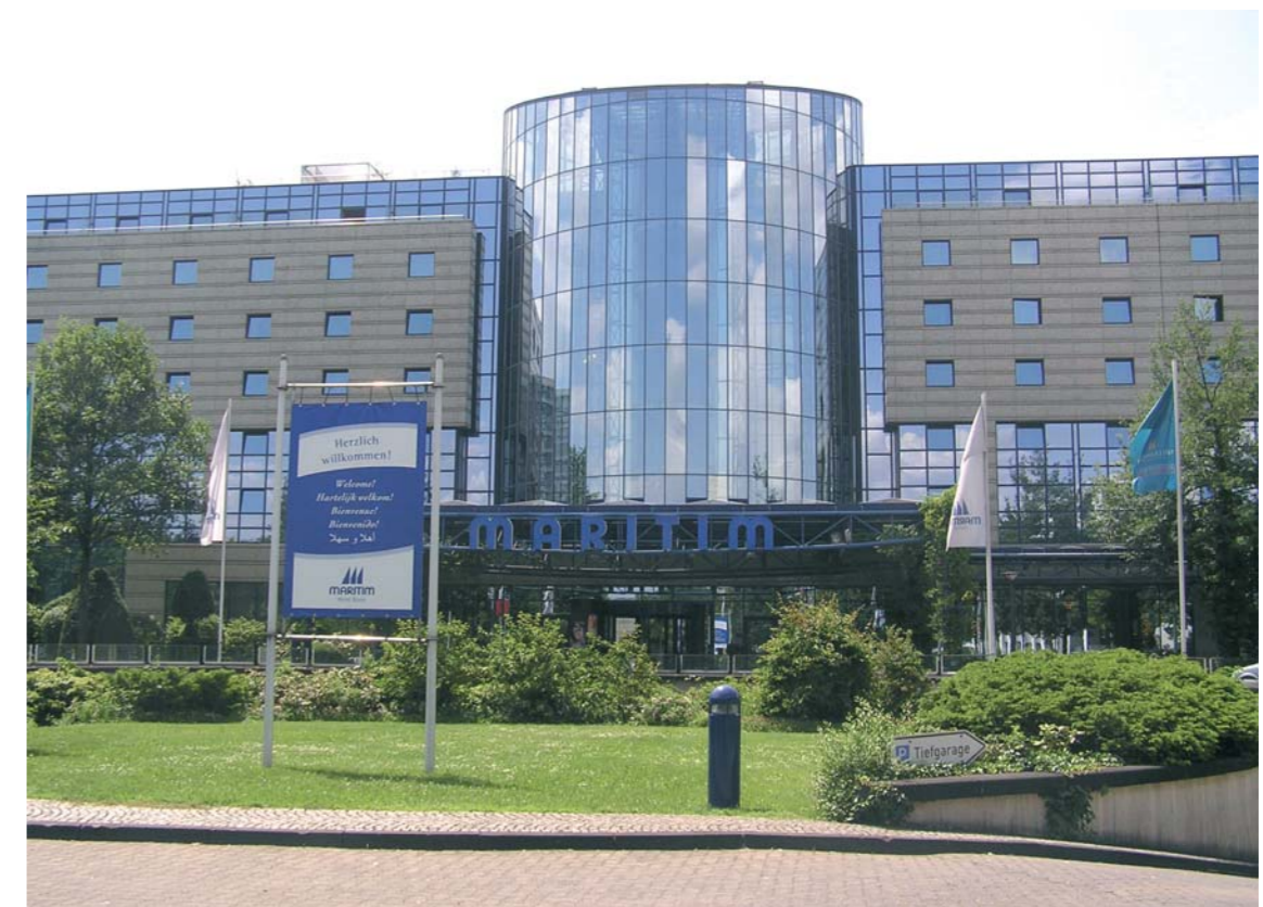
MARITIM Hotel Bonn

Tagen • Wohnen • Ausstellen Convention • Accommodation • Exhibition