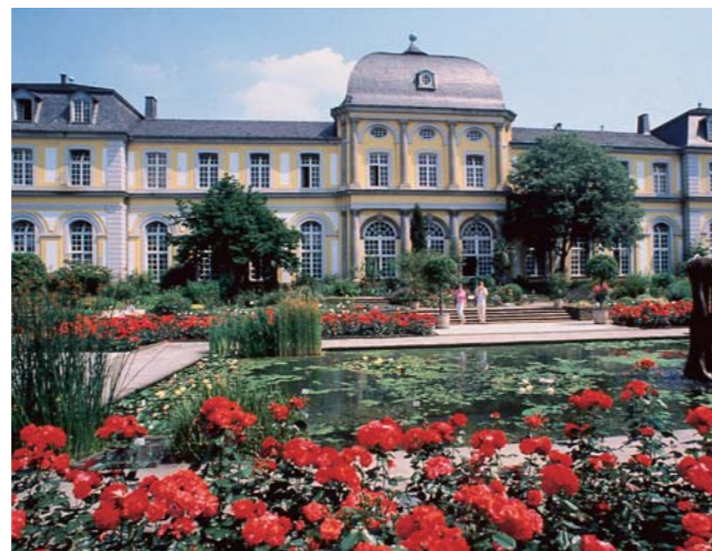
Poppelsdorfer Schloss / Poppelsdorf Castle